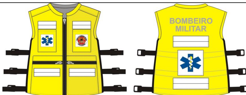
Imagem 2 – Modelo de Colete Socorrista com as respectivas medidas