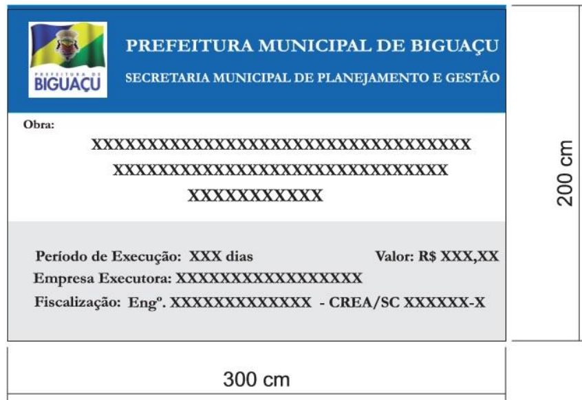
Figura 1 - Modelo padrão de placa de obra - Prefeitura Municipal de Biguaçu

A Contratada será responsável pela fixação das placas de obra exigidas pela legislação do CREA, e demais órgãos de fiscalização, bem como das placas indicativas do órgão repassador do recurso (caso exista) e do órgão responsável pela fiscalização. O desenho das placas deverá obedecer ao modelo padrão da Prefeitura de Biguaçu, sendo que os dados serão fornecidos pela equipe da Secretaria Municipal de Planejamento, não sendo permitida a utilização de placas de lona ou com letras autocolantes.