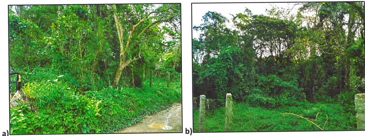
Figura 1 – Área indicada para instalação do sistema de tratamento (a) e terreno adjacente (b).

No dia 30/10/2019 foi realizada vistoria no local indicado para instalação do sistema de tratamento de efluentes. Não foram identificadas inconformidades em relação à documentação apresentada (Figura 1).