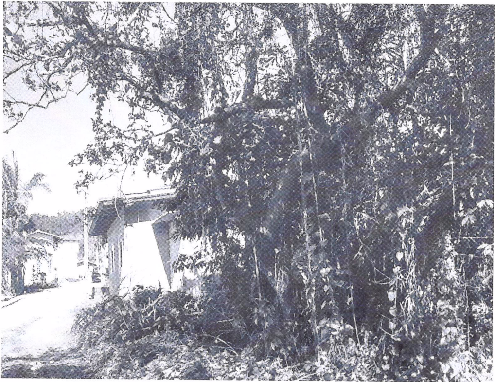
Figura 3 Porte do indivíduo arbóreo.