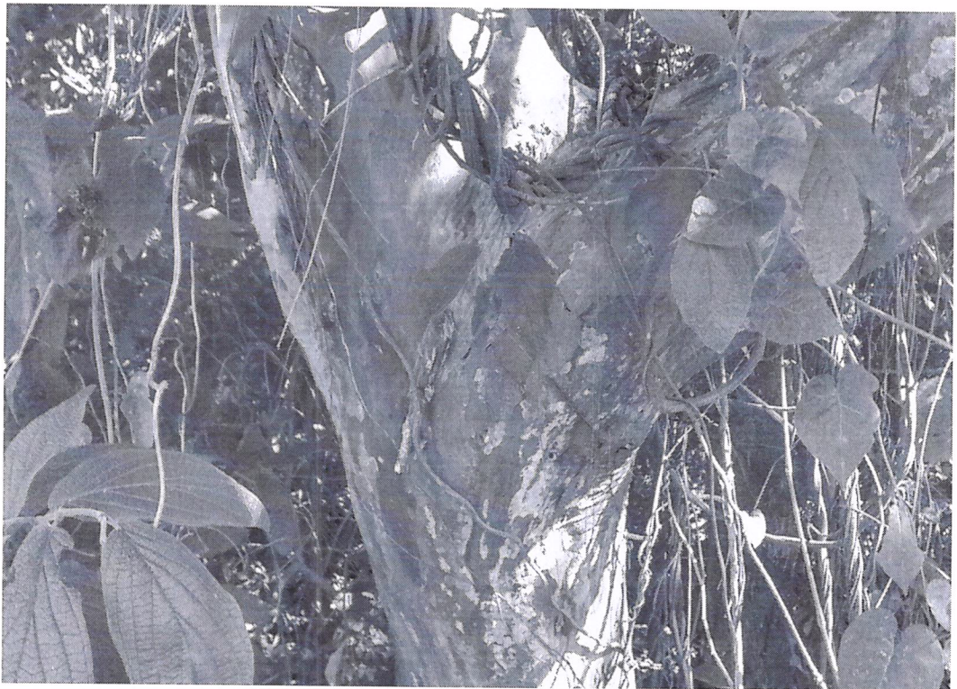
Figura 2 Tronco da árvore examinada.