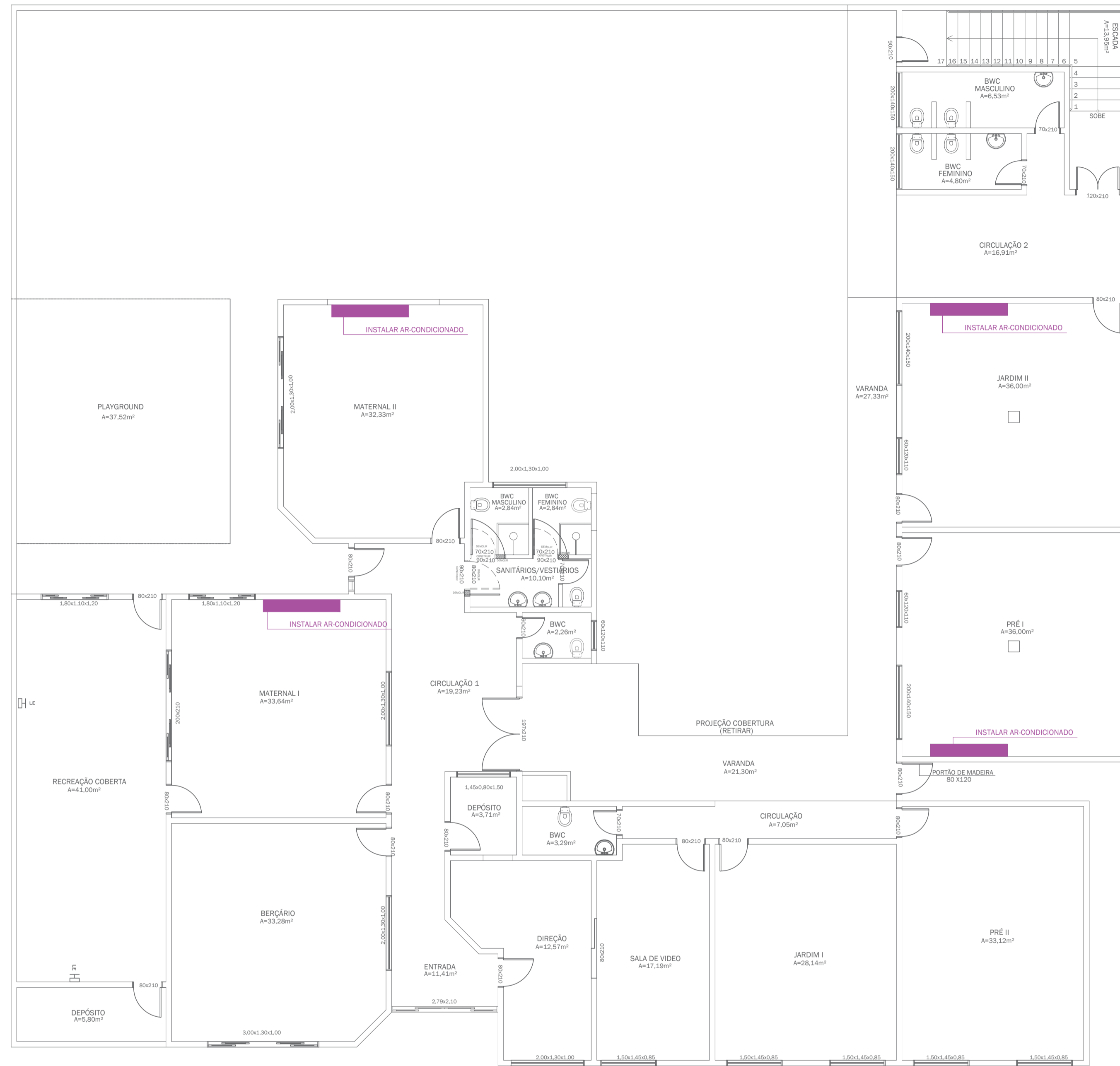
PAVIMENTO TÉRREO - EXECUTIVO ESCALA: 1/75