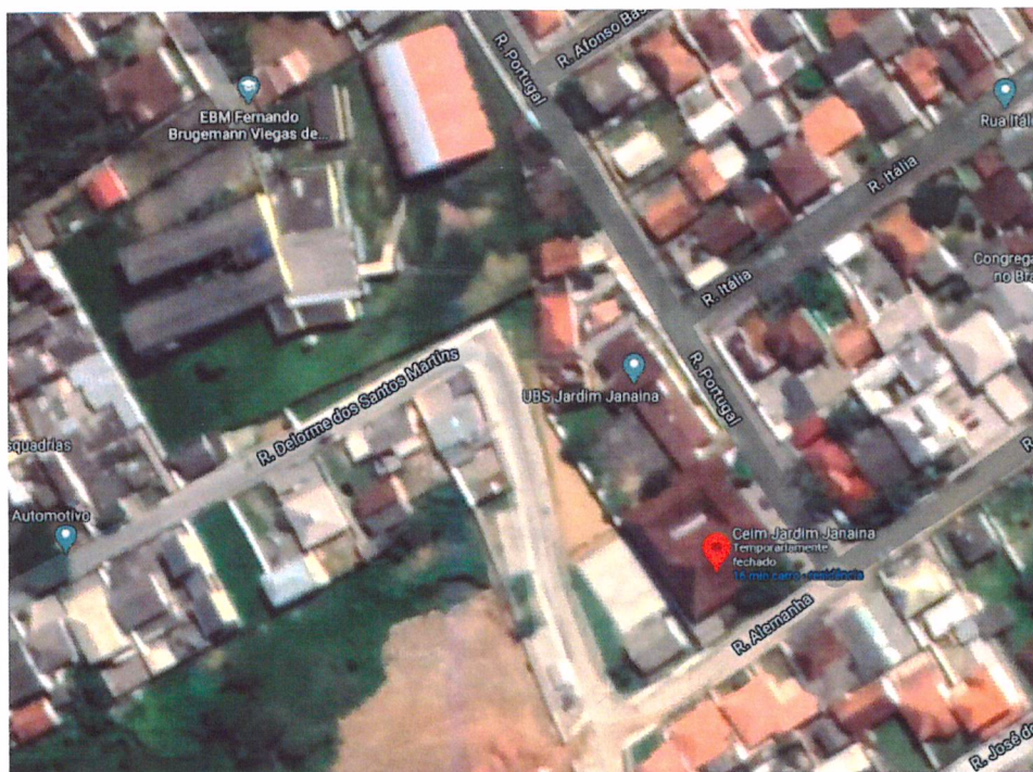
Figura 1 - Localização do terreno

No Centro de Educação Infantil Jardim Janaina no Bairro Jardim Janaina.