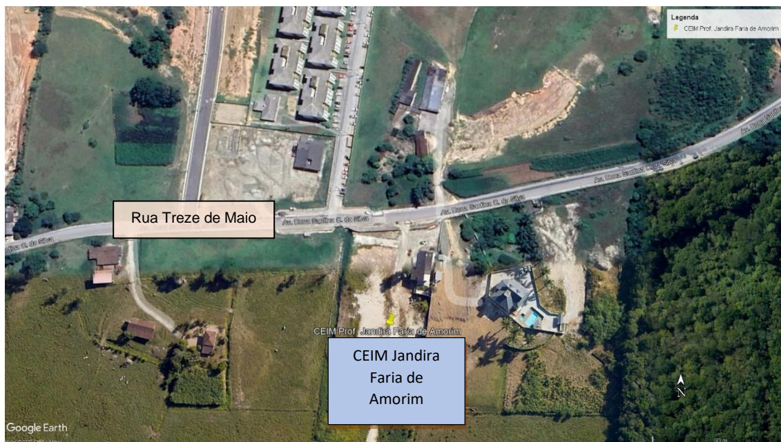
Figura 1 – Localização do trecho de projeto.

O presente memorial apresenta os dados para execução de muro de alvenaria no CEIM Jandira Faria de Amorim da Rua Treze de Maio, situada no Bairro Saudade, em Biguaçu/SC (Figura 1).